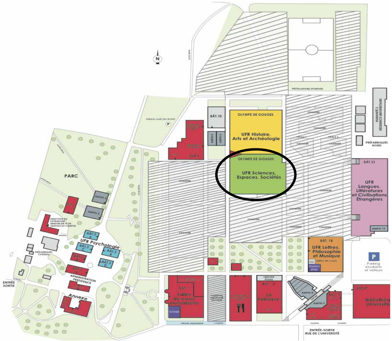
Métro ligne A (Rouge) Station Mirail Université