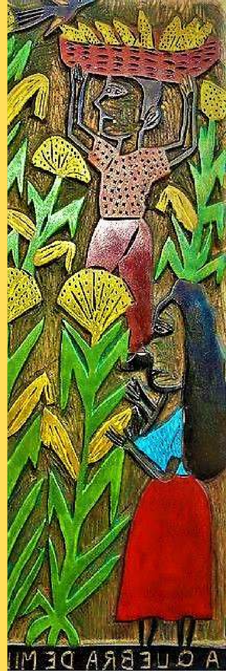
A QUEBRA DE MILHO